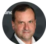
« LE BRIEF ÉCO » EMMANUEL CUGNY 6h45