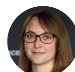
« FRANCEINFO JUNIOR » ESTELLE FAURE 14h53