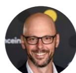
« HISTOIRE D'INFO » THOMAS SNEGAROFF