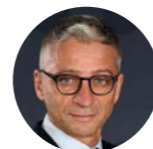
« 18.50 FRANCEINFO » JEAN-FRANÇOIS ACHILLI 18h50